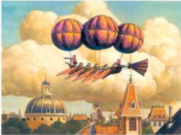
Zeppelin avançant par la force de ses rameurs.