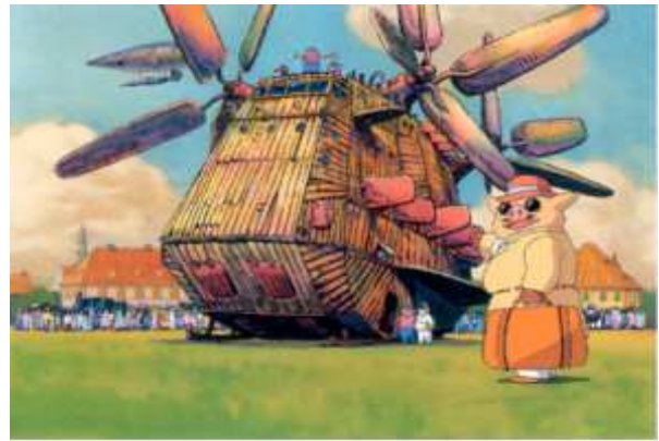
Avion de transport « Flying Box » se déplaçant par la force de l'électricité se trouvant dans l'air.