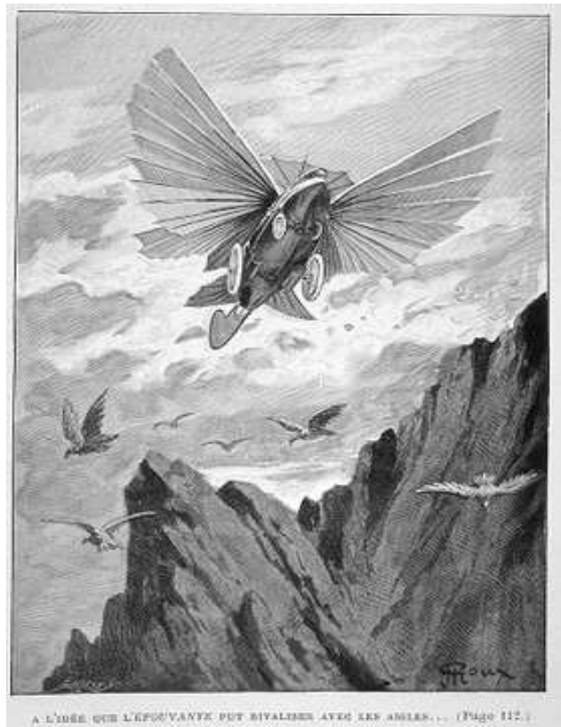
A L'IDÉE QUE L'ÉPOQUE PUT RIVALISER AVEC LES ANGLAIS... (Page 112.)