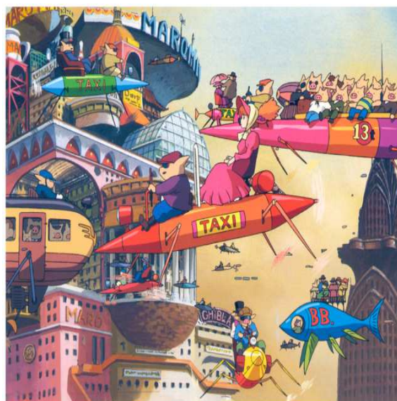
Taxis dans le ciel s'envolant librement.