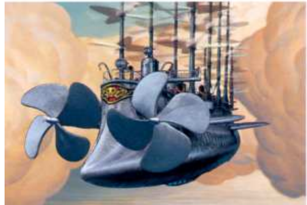
Cuirassé à hélices appartenant à des pirates apparaissant dans les nuages.