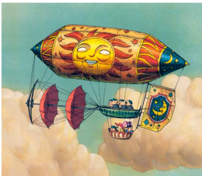
Montgolfière tentant d'avancer par l'action de l'ouverture et de la fermeture de parasols.